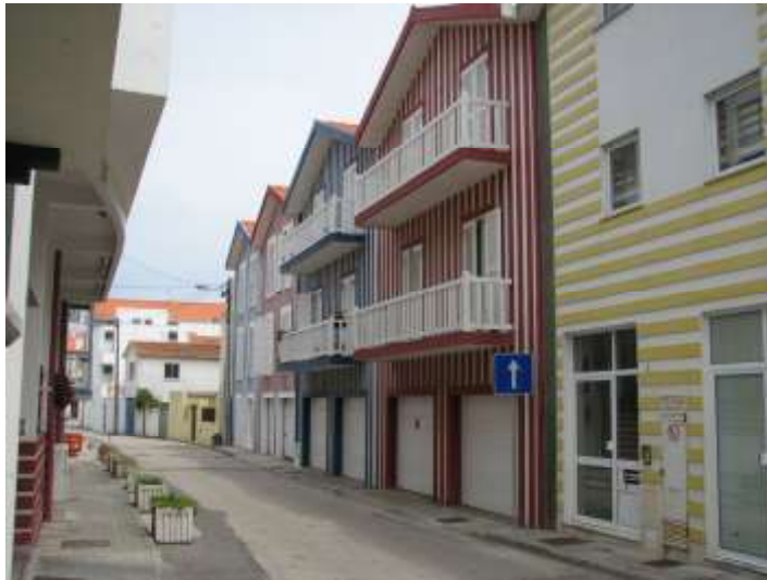
Prav lepo za pogledati. Na parkirišču