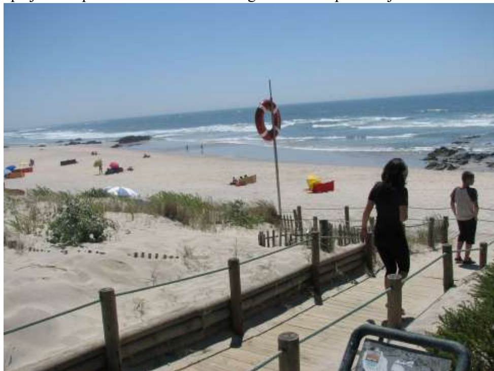
krasno peščeno plažo Praia de Afife

(N41,780998 W8,868664). Začeli pa so se že tudi oglašati želodčki. Ker je plaža izgledala prav lepa, restavraciji na plaži pa sta bili še obe zaprti, smo se odpeljali nekaj km nazaj proti Parque de campismo (takšno je portugalsko ime za kamp) Sereia da Gelfa, pred katerim smo že na poti pred Afife zagledali lepo restavracijo (N41,795982 W8,860312).