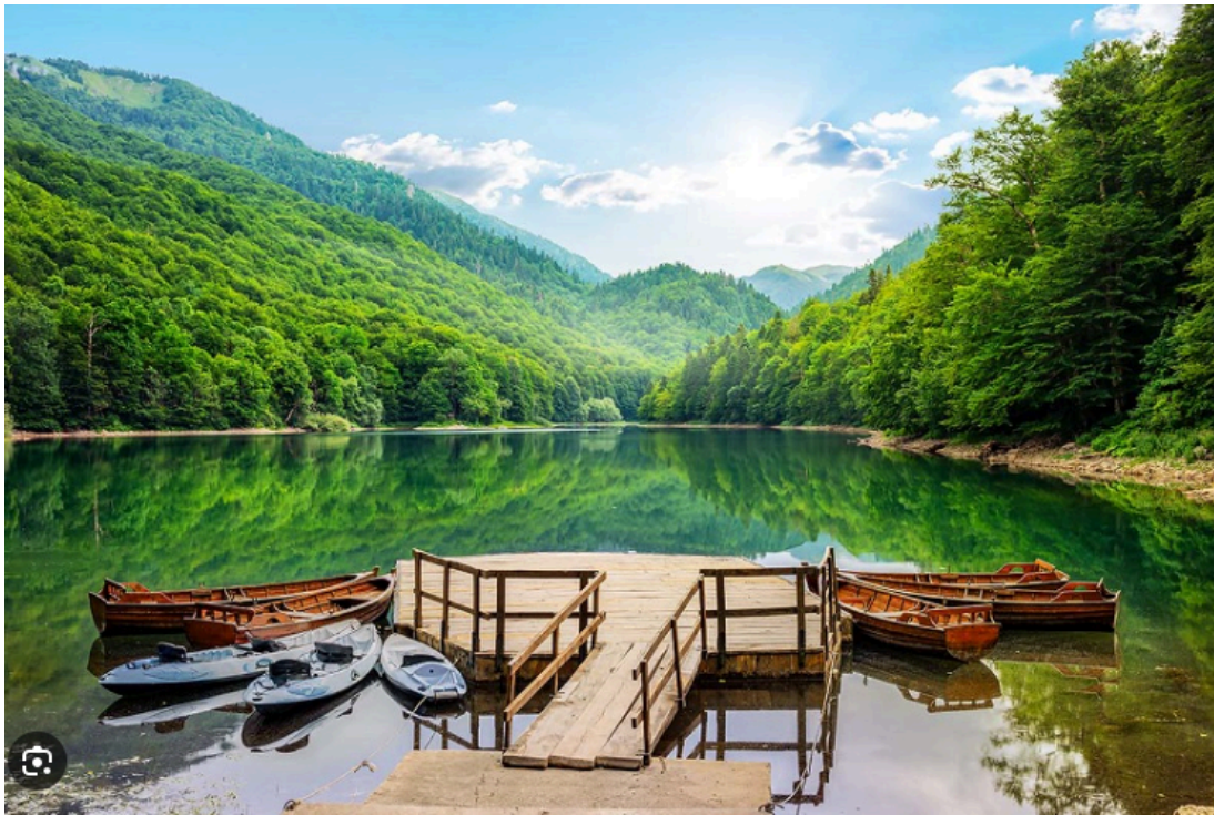
Kolašin – center