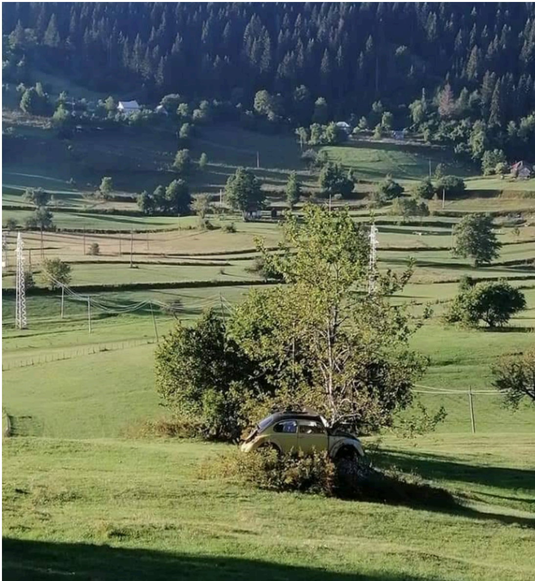
Pogled s ceste na Durmitor