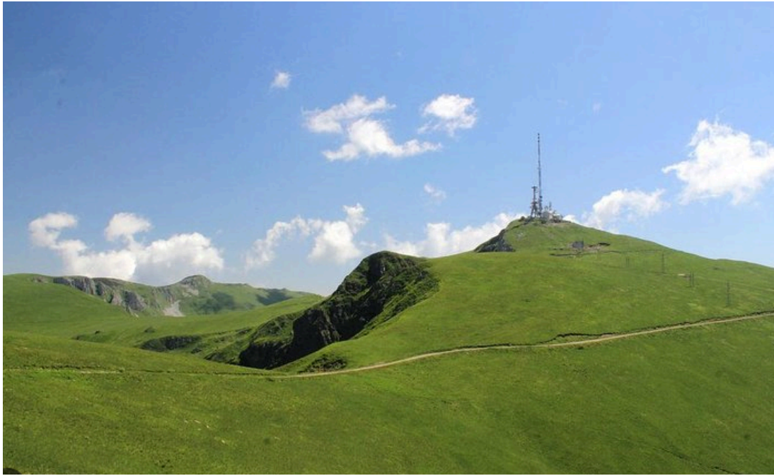
Pogled z vrha žičnice