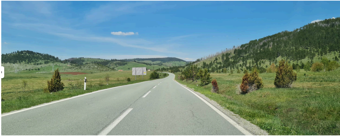
Manastir Svete Trojice