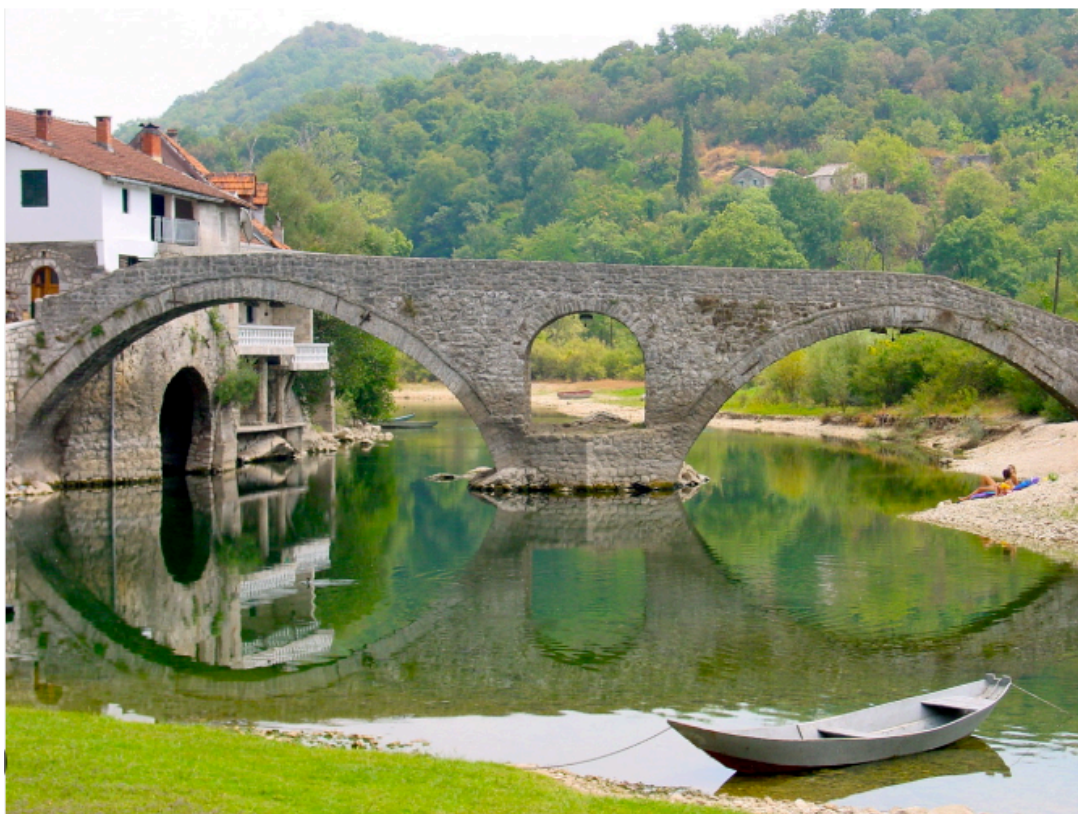
Fotografija: Danilov most

Za tiste, ki želijo še malo zgodovine in sprehoda, se lahko omeni tudi Obod / Riječki grad, ki leži nad naseljem na drugi strani reke. Gre za zgodovinsko pomemben prostor, povezan s Crnojevići in staro tiskarsko tradicijo, vendar ga ne bi smeli postaviti kot obvezni del programa za celotno skupino.