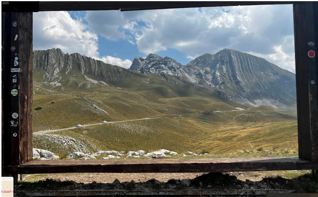
Pogled s ceste na Durmitor