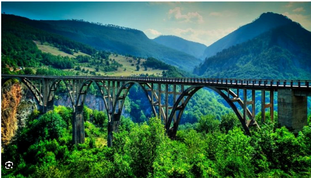
Kosanica / Pljevlja