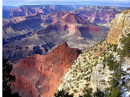
View from near Mohave Point