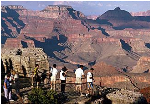
View from Mather Point