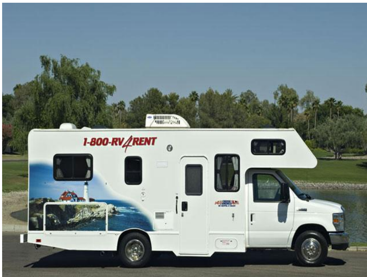
C25 STANDARD RV